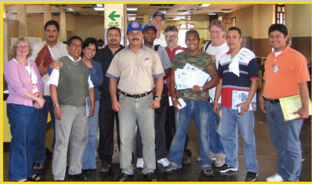
Une délégation du STTP rencontre des représentants du syndicat des travailleuses et travailleurs des postes du Venezuela.