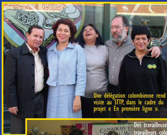
Une délégation colombienne rend visite au STTP, dans le cadre du projet « En première ligne ».

Les pressions en faveur de la privatisation des services publics en Amérique du Nord s'inspirent du même modèle de mondialisation appliqué au Guatemala, en Colombie et dans d'autres pays du Sud.