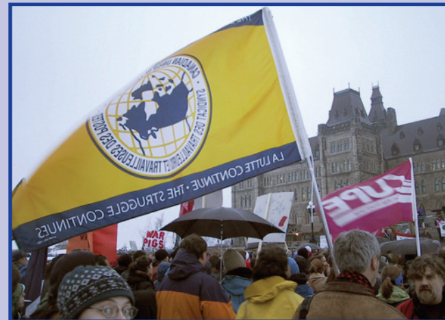
Des membres du STTP manifestent contre la guerre en Irak.