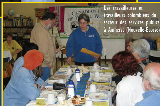
Des travailleuses et travailleurs colombiens du secteur des services publics, à Amherst (Nouvelle-Écosse)