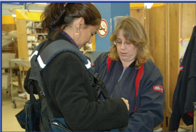
Une travailleuse des postes du Brésil essaie une sacoche de factrice dans une installation postale à Ottawa.